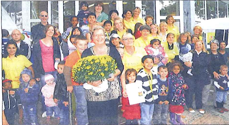
Ein großer Tag für die Bewegungskita Schweidnitzer Straße. Sie feierte die Fertigstellung ihres Außengeländes und gleichzeitig freuten sich alle über die Auszeichnung der Hamburg Sportjugend.

Hamburger Sportjugend ehrt Bewegungskita Schweidnitzer Straße